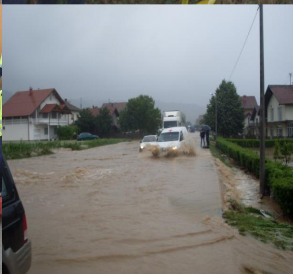
Poplave-Magistralni put Doboj-Tuzla u D.Orahovici, 2010. godine