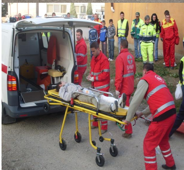
Vježba "Pomoć u nesrećama 2009. godine"